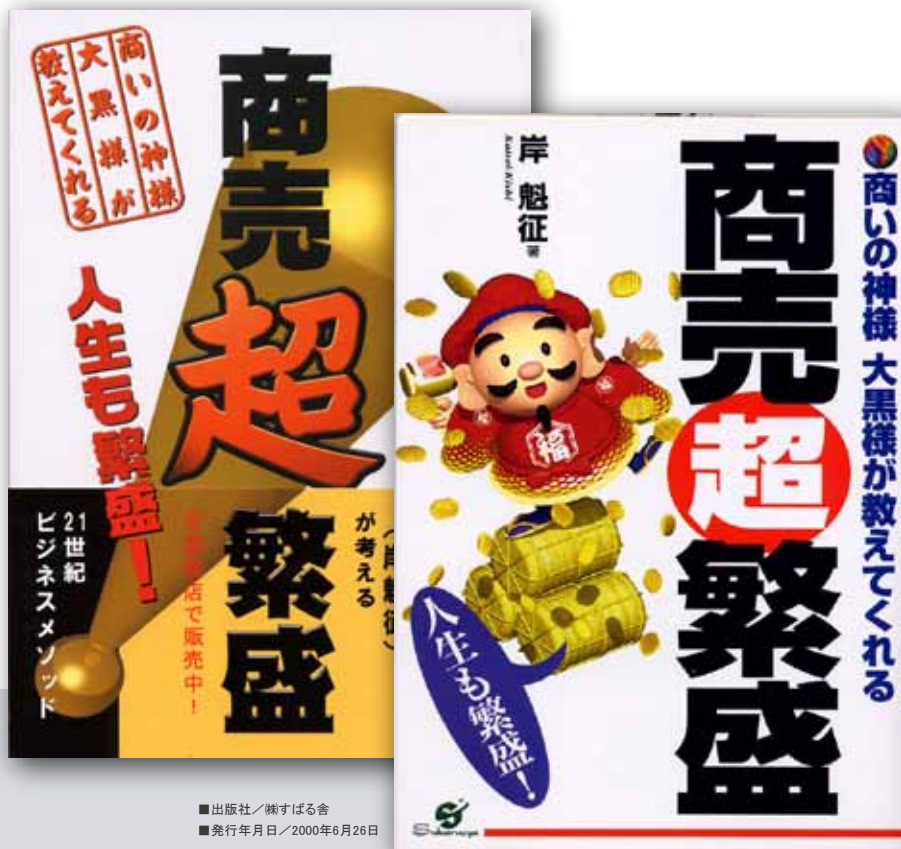
■ 出版社／株式会社 榊原出版 ■ 発行年月日／2000年6月26日